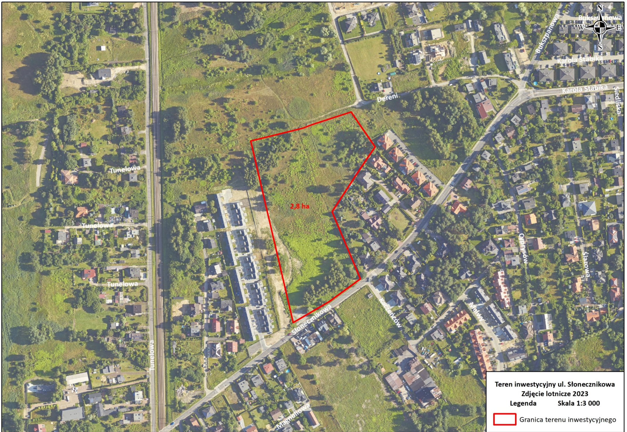
Teren inwestycyjny ul. Słonecznikowa Zdjęcie lotnicze 2023 Legenda Skala 1:3 000